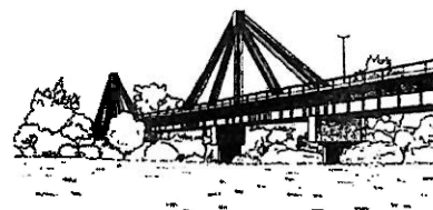
Ponte canale impianto di depurazione Roma nord 1980 d.C.